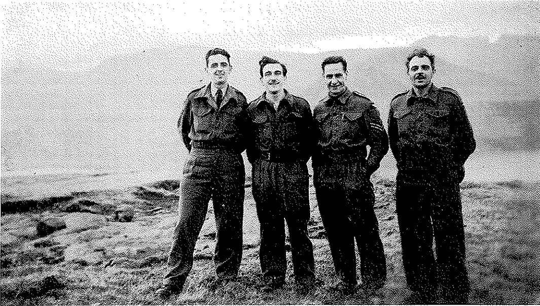
Fýra av hermonnum, ið vóru knýttir at bretska herstöðini á Eiði.

byggja hús uppi á Kolli, og annað stoypi-arbeiði. Hesin dagur mundi vera fyrsti arbeiðsdagur fyri bretska hervaldið á Eiði.